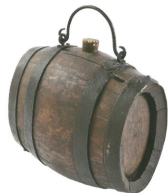
LES TONNELETS EN BOIS